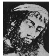
Euclid (ギリシャ, 330?-275? B.C.)